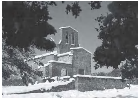
El Grau nevat

Fins i tot gent de Manresa i d'altres pobles mostrava la seva devoció amb llegats, algunes vegades ben substan-