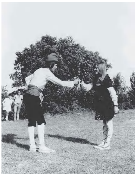
Ball de l'Almorratxa (c. 1975)

A Fals, el Ball de l'Almorratxa és ballat per una parella sola que, generalment i quasi cada any, és la que es casarà durant el proper any. Antigament, les dues cases encarregades de la festa, eren les que hi aportaven els balladors, una hi aportava el noi i l'altra la noia. Si una de les cases no tenia la noia la buscava en una parenta o cosina. També havia estat ballat, antigament, per la filla de la Majorala