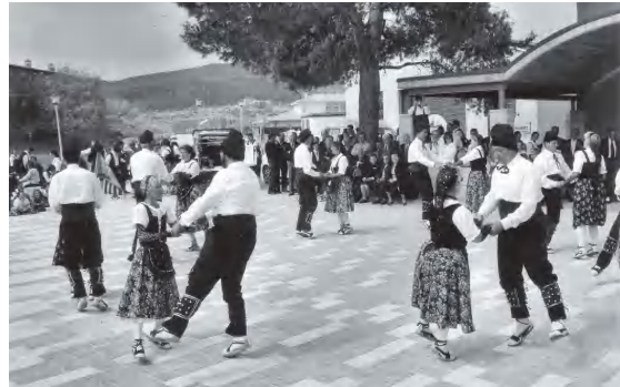
Ball de Cascavells

La partitura està en compàs binari i la melodia té algunes diferències en les dues ballades. Per Pasqua, es balla generalment al so d'un acordió o d'un sol instrument, que a la vegada, també és el que acompanya el cant de les Caramelles. En la ballada per l'Aplec, el Ball dels Cascavells