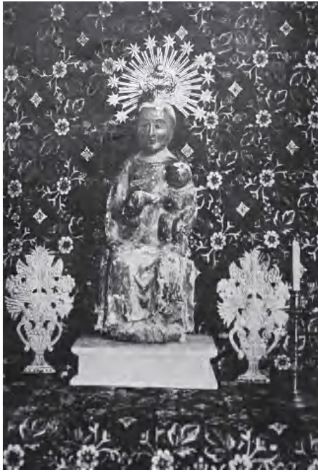
La imatge vella de la sagristia

mostra lleugers vestigis de la policromia original. Es tracta d'una Mare de Déu amb el Nen en posició sedent. La mare sosté el nen assegut sobre el seu avantbraç esquerre, mentre que amb la dreta aguanta una bola que sembla que el nen li ofereixi. La mare porta túnica i mantell obert fins a la cintura, des d'on creua fins al costat esquerre formant una mena de bordó. Els peus de la mare reposen sobre una tarima que forma una única peça amb el setial. Aquest, de tipus senzill, més que un tron sembla un banc o escambell, amb els muntants ben diferenciats.