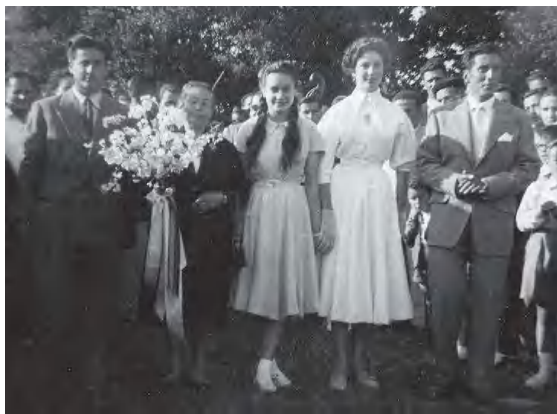
Ball de l'Almorratxa (c. 1960)

cipis del segle XV i amb una diversitat de noms, segons la comarca. És un petit recipient de vidre, de cos ventrut com un càntir, però amb un broc gros central en lloc de nansa, i quatre galets o brocs prims al voltant del gros: S'omplen, en general, amb aigua d'olor (aigua-ros o aigua amb essències de roses) i s'adornen amb flors i penjarolls de cintes de colors. N'hi ha de conservades en museus i col·leccions particulars, en vidres de variats colors, policromades i esmaltades que tenen un veritable mèrit artístic.