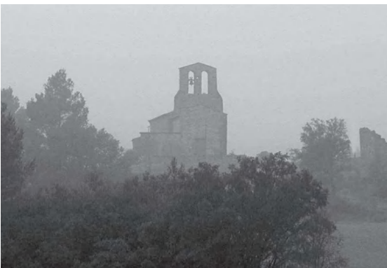
Un matí de boira

Segons Pladevall, des dels volts de 1154 la capella del Grau tenia la consideració de parròquia, condició que va perdre al segle XIV en quedar vinculada a l'església parroquial de Sant Vicenç. Potser la denominació de "sufragània" que rep aquell veral, és una reminiscència d'aquesta feta.