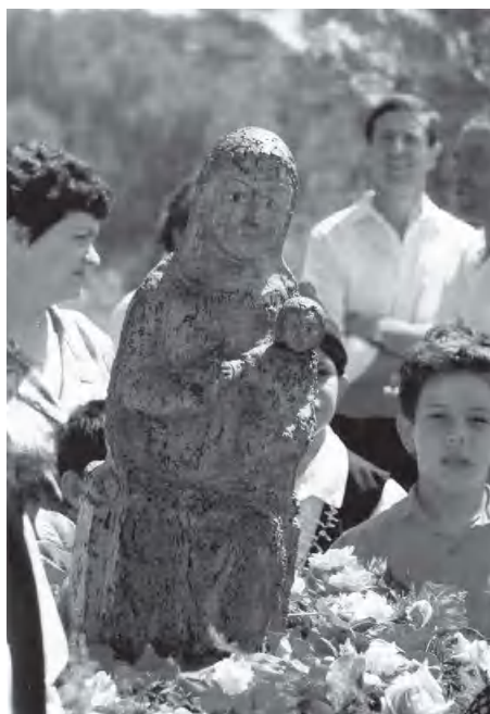
Processó de retorn