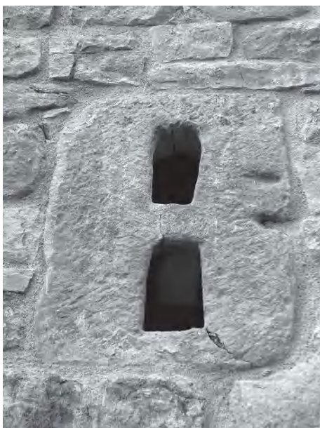
Finestros al cantó de migdia

La primera descripció escrita de la capella del Grau la trobem en l'opuscle de Ramon Grau. Segons ell, l'edifici mesurava interiorment 21x52 pams i els murs eren d'uns 7 pams de gruix. La nau estava orientada d'est a oest, l'altar estava adossat a la paret oest i el portal donava a l'est. Segons la llinda, el portal s'havia obert el 1694, i el Ramon va suposar, encertadament, que abans de l'ampliació i l'obertura del portal, l'altar devia estar situat al cantó est. Es va equivocar però, en la interpretació sobre l'antiguitat de les dues seccions de la nau; va considerar que l'afegitó era la part oriental, on hi havia el cor, i que la part més antiga era la part occidental. És justament al contrari, com oportunament veurem.