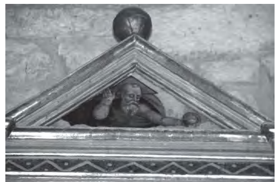
Remat superior del retaule

El 1880 es va arranjar l'entorn del retaule amb l'adquisició de dos canelobres de vuit espelmes cadascun, situats a banda i banda de l'altar. Al costat d'aquests s'hi van posar uns suports del mateix estil destinats a sostenir un gran ciri. Al mateix temps es va canviar el vell frontal de l'altar per un de nou, on hi figurava el nom de Maria envoltat amb una garlanda de roses, com si fossin les denes d'un rosari.