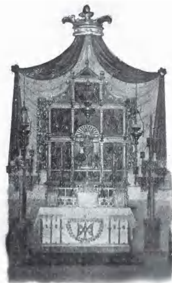
Altar a principis del segle XX

que era una versió primitiva de la mateixa, que es remuntava segurament al temps de la construcció de la primera capella.