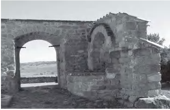
Vestigis de la Mongia

Diputació, va inaugurar oficialment les obres de restauració, amb assistència de les autoritats locals i la majoria del poble de Fals.