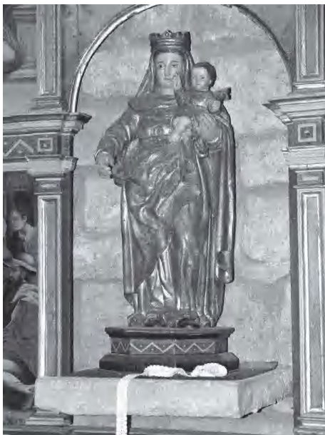
Imatge moderna de Santa Maria

Al Grau hi ha dues imatges de la marededéu, una antiga i l'altra més moderna, però encara n'hi podria haver hagut una de més vella. Aquesta ha desaparegut i ignorem on ha anat a parar.