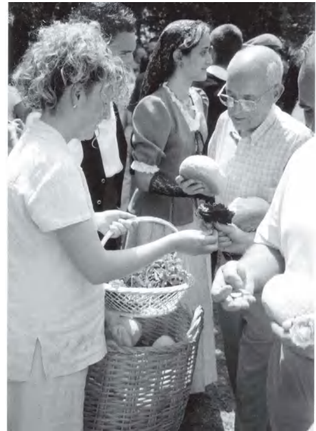
El repartiment del "panellet"