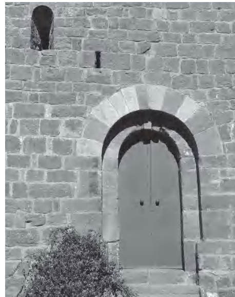
Portal de migdia

El gener de 1980 Lluís Solernou va trametre a l'Ajuntament un projecte de restauració de l'ermita del Grau. Exposava les obres que s'havien fet fins al moment de manera voluntària, que avaluava en unes 300.000 pessetes, sense comptar els jornals, i alertava d'un problema greu a causa dels moviments que afectaven l'edifici. L'arrel del problema era el fet que la capella no tenia fonaments, sinó que estava directament assentada sobre la codina. El projecte també contemplava l'eliminació de la sagristia, la il·luminació interior, la pavimentació, i la recuperació de la primitiva orientació de l'altar de la capella.