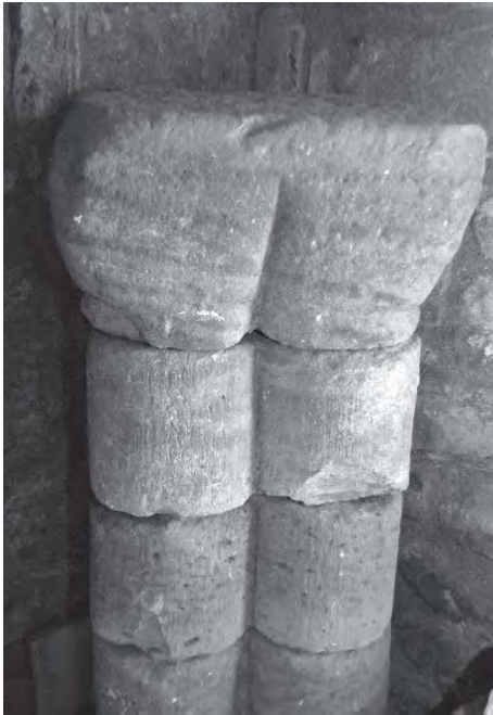
Columnetes de l'arc triomfal

La volta de l'antic presbiteri (secció preromànica) està construïda amb pedres planes posades en forma de plec de llibre fixades amb morter de calç, sota de les quals encara és visible l'empremta de l'encanyissat de la mulassa. La secció de l'arc és una mica reentrant, del tipus dit de falsa ferradura.