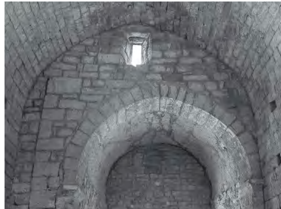
Unió de les dues voltes

També va descriure el campanar, que s'aixecava uns 30 pams sobre la part superior del temple, i les dues campanes que a finals del segle XIX hi havia al campanar.