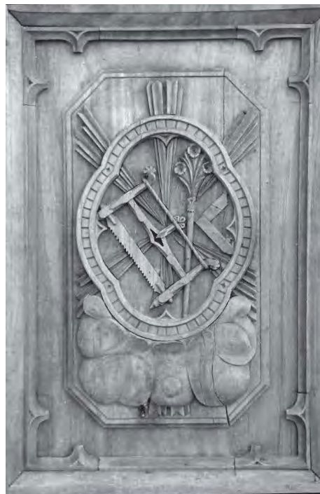
Frontal de la trona

Els llegats solien ser en diner, però n'hem trobat un en espècies, en el testament de 1650 d'Antoni Bosch, l'amo del mas Bosc, el qual va deixar al Grau 11 quarteres de calç, segurament elaborada en el forn de casa seva. Aquesta dada indica que en aquell moment s'estaven fent obres a la capella.