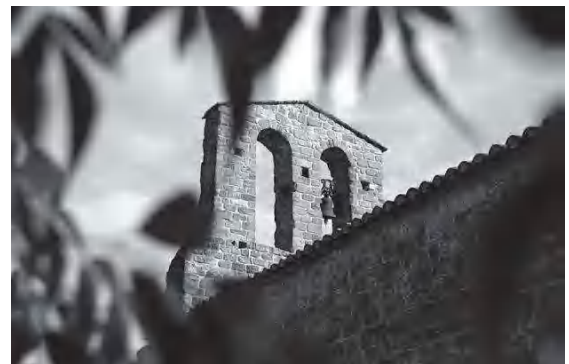
Detall del campanar

Una altra festa que se celebrava al Grau era el Nadal. El dia abans els de la sufragània decoraven l'altar amb flors i ciris, muntaven un pessebre, i cobrien el terra amb espigol. L'endemà el rector hi celebrava una missa major cantada a l'hora de la sortida del sol.