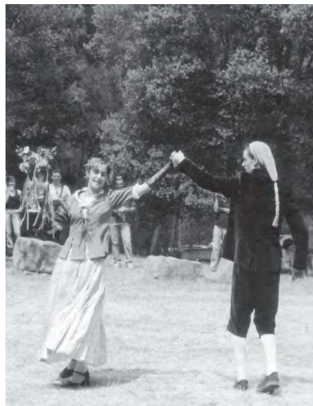
Ball de l'Almorratxa actual

La coreografia de la dansa està formada per: a) Passeig del noi, fins arribar davant la noia, evolucions i salutació; b) La noia accepta el noi i ambdós formant parella fan el