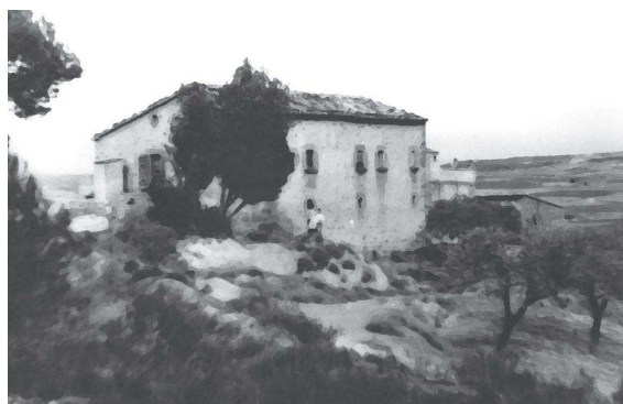
Mas Tatger (c. 1950)