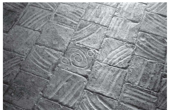
Terra de rajoles de la sagristia

En el seu informe va remarcar que a la capella no hi havia pica baptismal, i que el rector hi deia missa un diumenge sí i un altre no. Al districte de la sufragània hi havia només quatre cases habitades, les quals elegien dos Obrers o Priors, que es renovaven cada any. Va instar als Obrers que fessin adobar les parets i la teulada de l'edifici, que presentaven deficiències. En respecte al culte va redactar el següent escrit: Manam als obrers de la Iglesia de St Andreu que sobre lo altar fassen fer un sacrariet capaz per tenir lo calçer, reservat sobre uns corporals y ara, després que lo rector ha çelebrat la Missa matinal, y peraque lo sacrariet no ocupe gran part del altar, lo encaixarán dins la grada, tallantla a proporcio del sacrariet; la ara que está en lo altar, per esser petita, se pose dins lo sacrariet y se prenga una altra major, la qual cuberta de tela blanca se encaixará en son lloch; faran una alba y un amito y estola y manible per la casulla negra, uns corporals y dos purificadors, dos bolsas de corporals que vingan a tenir los colors blanch, vermell, vert, morat y negre; y fassen aplatat