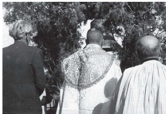
Benedicció de la campana "Eudalda"

Les notícies sobre la capella durant els segles XIX i XX són molt escasses i irrellevants.