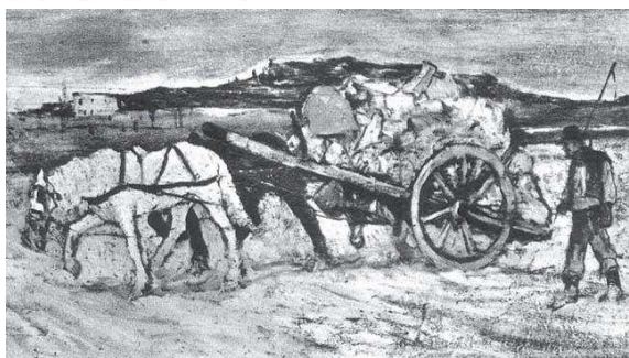
Carro carregat (gravat)