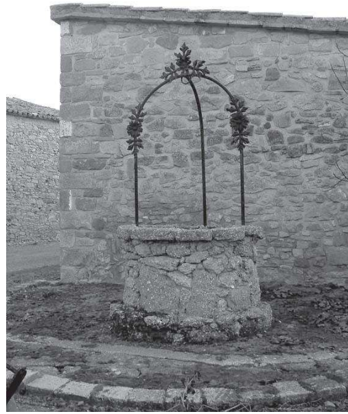
Pou del mas Montconill