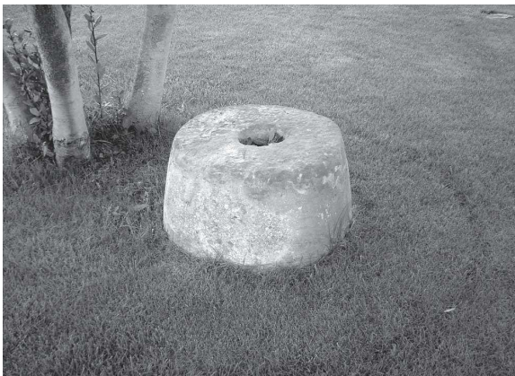
Antic corró de pedra

En la relació dels masos de 1303 hi surten un "alberch dez Lado" i un mas de "Cervaria del Lado". El primer paga els mateixos censos en espècie que solen pagar els altres masos del terme, és a dir, els feixos de llenya, palla i herba,