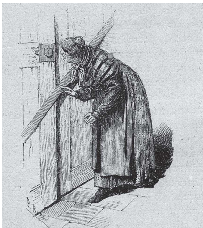
Dona vella (gravat)