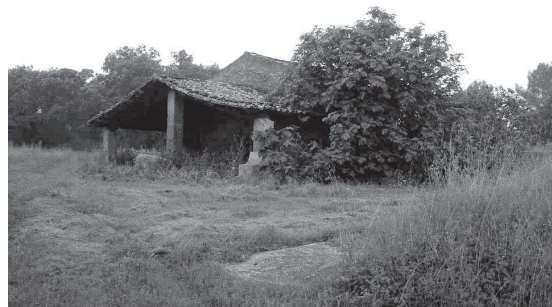
Era i cobert