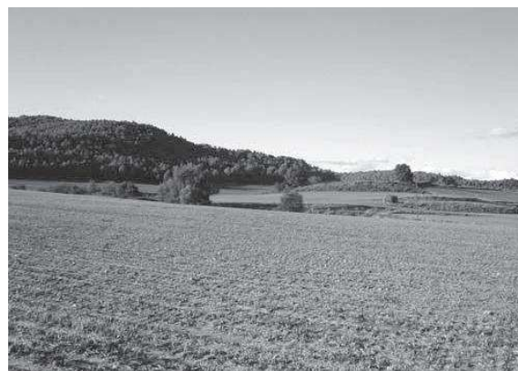
Siti del mas Coll

De la casa actualment no en queda res, però se sap amb certesa on era. A uns cinquanta metres de la Creu en direcció nord, els més vells del poble recorden haver vist les restes d'un edifici, i encara ara, en llaurar, sovint surten pedres tallades procedents dels fonaments d'una antiga construcció. Segons aquests indicis, la localització aproximada del mas estaria en el coll natural entre les Costetes i el Collet de les Forques, i en la divisòria entre les conques de la riera de Rajadell i de Fonollosa.