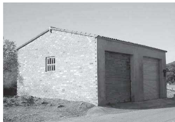
Cobert del sindicat

Les finalitats del sindicat eren facilitar als associats la compra de maquinària i utilitatge agrícola, adobs, llavors, remeis contra les plagues, sementals, etc, i també la difusió del coneixement i l'estudi de temes relacionats amb la modernització de l'agricultura i la ramaderia. Si volia, el sindicat podia crear caixes de crèdit o dipòsits