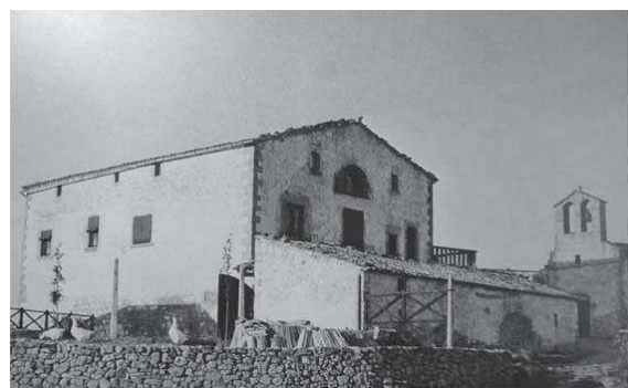
Vista c. 1950