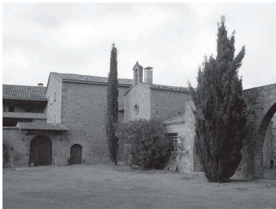
Entrada est i capella