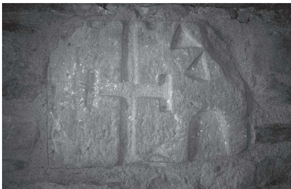
Fragment de làpida encastat a la paret

posseïa 1.200 jornals de terra, el mas principal, i un mas rònc dit el Maset, i que per això pagava anualment un cens al Duc de dues gallines i vuit punyeres de civada. Va reconèixer també que pagava delme al senyor del terme de Sant Mateu, primícia al rector de la parròquia i a la Pabordia de Caselles, i que també pagava cada any dues gallines i dos quartans de gra al senyor Abat de Montserrat. Això demostra que la situació dominical d'aquest mas era complexa i ben diferent de la resta de masos del terme.