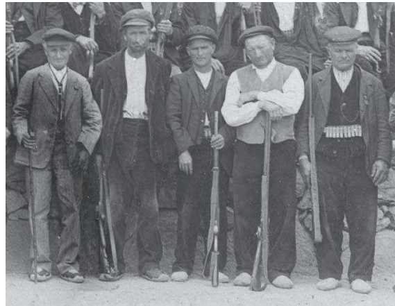
Homes del sometent de Fals