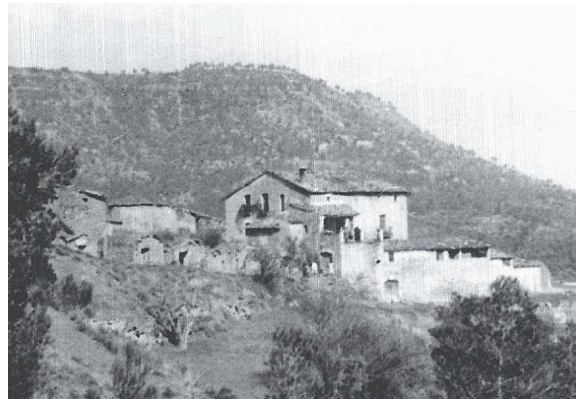
Mas Torreblanca (c. 1945)