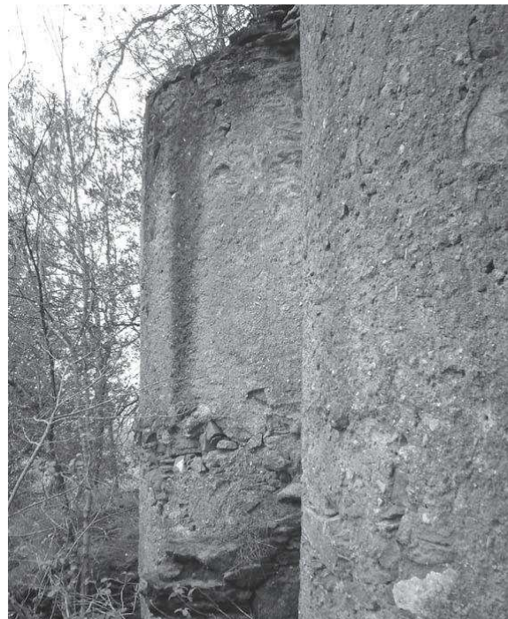
Conjunt de tines