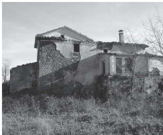
Mas Bosch: estat actual

Potser coexistien dues o més famílies amb el mateix