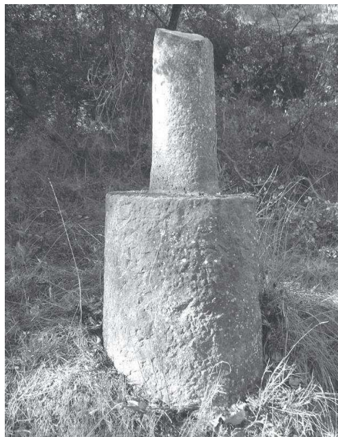
Base de creu de terme

Isidre Riera Oller (1814 -1886) va ser una persona rellevant de la societat local del seu temps. Des d'abans de 1857 fins el 1860 va ser el Jutge Municipal, exercint les seves tasques a les dependències del Molí de Boixeda, i a