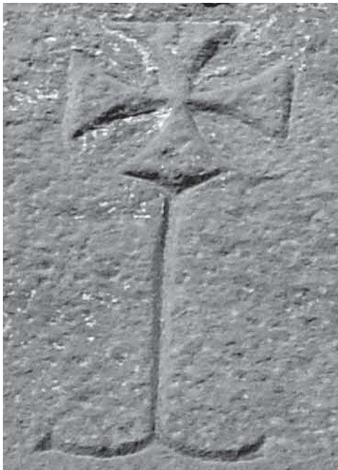
Detall d'una finestra