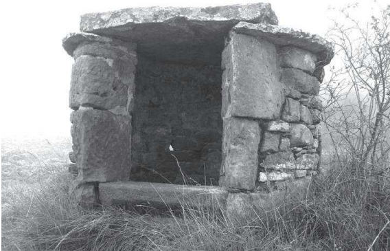
Pou (foto actual)