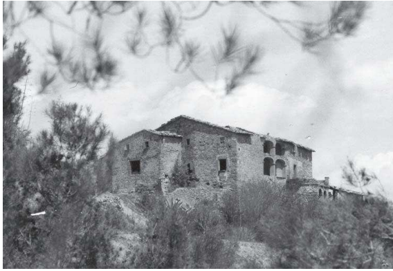
Vista general (c. 1980)

El següent amo va ser Isidre Torras Subirana, fill de l'Isidre anterior i d'Estefania. L'octubre de 1715, l'Isidre va llogar per un període de cinc anys tot el mas a Vicenç Torras Subirana a canvi del deute reconegut pel seu pare difunt. Els tractes de la cessió són molt complets i abasten aspectes que van des del conreu de les terres fins al repartiment de les contribucions. L'Isidre es va retenir el dret d'utilitzar una habitació de la casa, per a ell i la seva família, i el dret de pasturar tres rucs de la seva propietat. Per la seva banda, el masover li havia de donar cada any 40 lliures carnisseres de carn de porc, més la cinquena part de la collita de les quintanes i altres sembrats, i la meitat de la de vi, oli, peres, nous i altres fruites d'estiu. Els aglans del bosc quedaven pel masover, que també estava autoritzat a vendre sis càrregues de llenya cada setmana. En contrapartida, el masover s'havia de fer càrrec dels "allotjaments" dels soldats – no oblidem que eren temps de guerra i al Principat s'hi trobaven moltes companyies de soldats espanyols, la despesa dels quals requeria feixugament sobre la població-, assumir els "bagatges", o transport per compte de l'exèrcit, i pagar els "talls", o contribució al Rei.