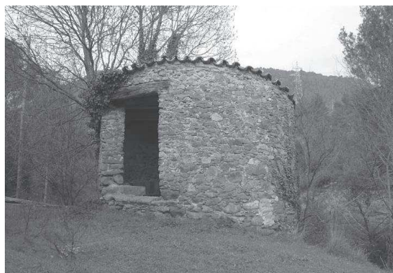
Tina situada prop de la casa

Les dimensions d'aquest conjunt són: dues tines de diàmetre de 2,30 m, i una de diàmetre 1,85 m, mentre que les quadrades totes dues són de 1,60x1,60 m. Pel que fa a les alçades, aproximadament totes tenen una alçada de 3,20 m. Val a dir que sempre que es donen mesures d'alçades es refereix a l'alçada de cairons esmaltats, és a dir des de la bancada superior on s'hi col·locaven els llistons fins al nivell de la boixa. La capacitat total d'aquest conjunt és aproximadament de 51 m 3 .