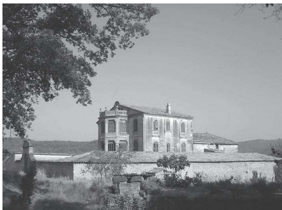
Mas Massana. Vista est