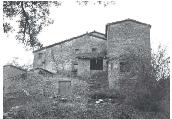
Mas Massana. Vista nord