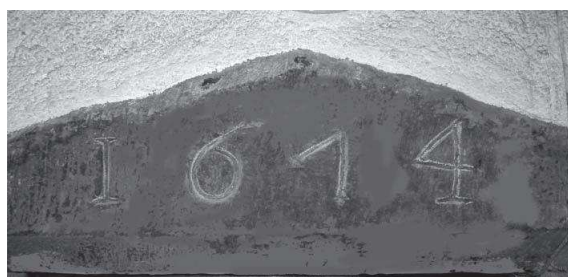
Llinda d'una cambra de la sala