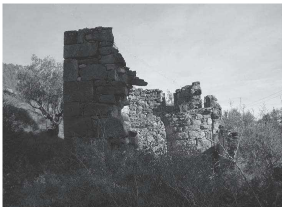
Ruïnes de la casa