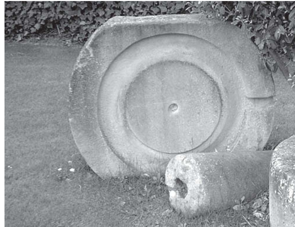
Base de premsa i corró.