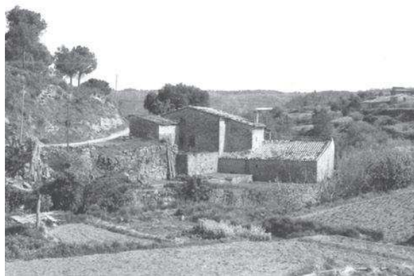
Vista general (c. 1980).

1868". La falta d'ortografia s'ha d'imputar al picapedrer. En una finestra de la banda de llevant hi ha una llinda datada el 1695 que és apòcrifa, és a dir, que no correspon a la casa. Aquesta finestra va estar tapiada fins l'any 1992.