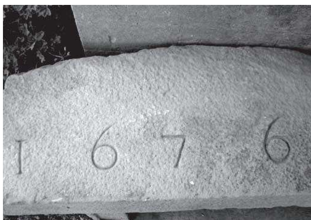
Antiga llinda (1676).