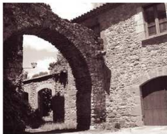
Vista de l'interior del Clos