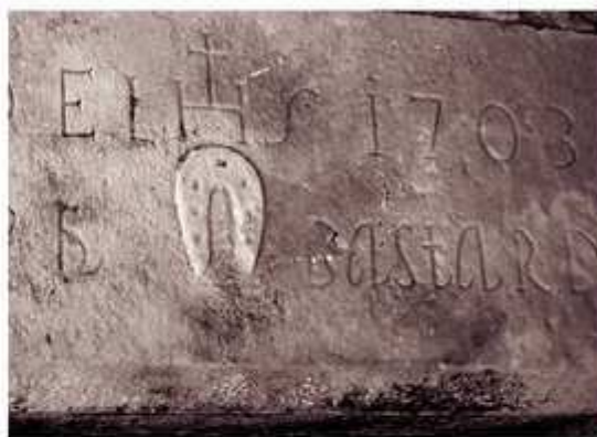
Detall de la llinda de la ferreria