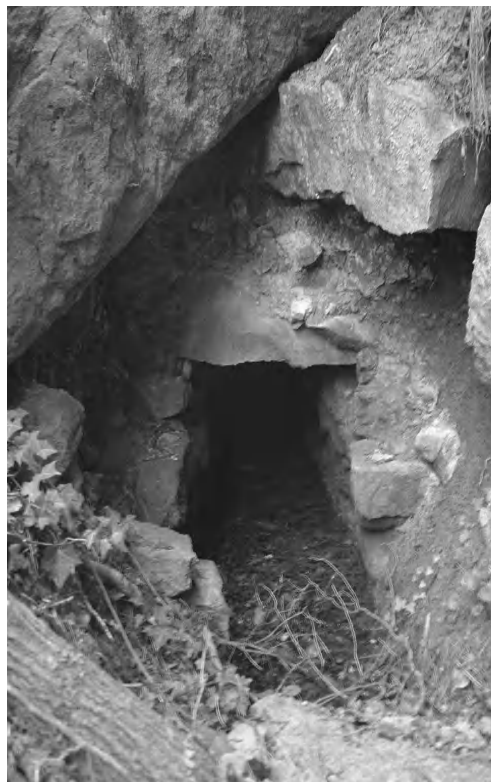
Tram cobert del rec

Aquest topònim, "la vinya del Molí", i l'existència d'un camí que baixava per darrera del castell cap al molí, sembla indicar que abans del Molí que ens ocupa, n'hi havia hagut un altre de més primitiu, al mateix lloc o molt a prop.