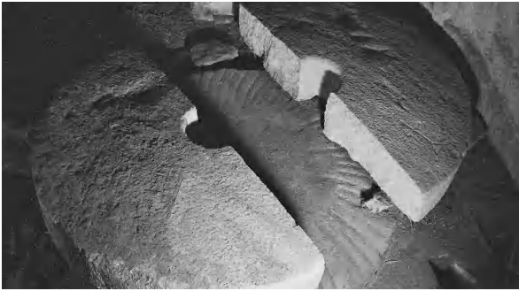
Mola superior trencada