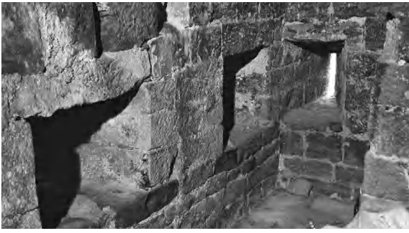
Espitlleres al primer pis