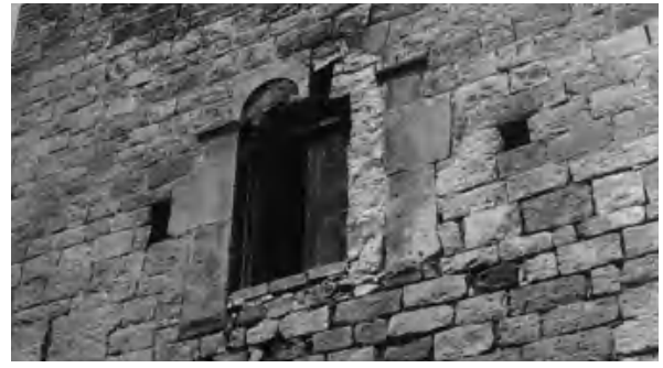
Detall del finestral gòtic