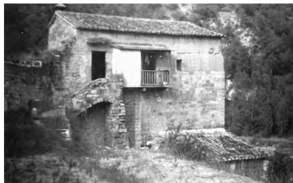
Vista general (1975)