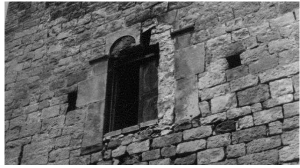
Detall del finestral gòtic