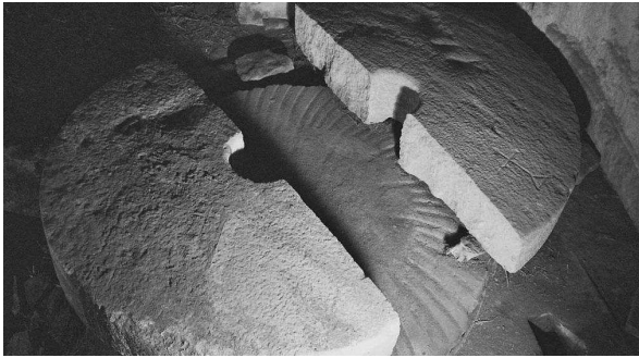
Mola superior trencada