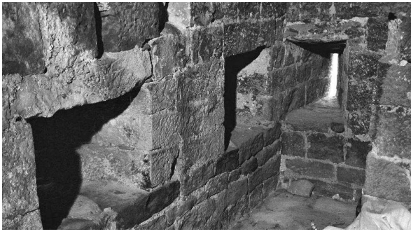
Espitlleres al primer pis