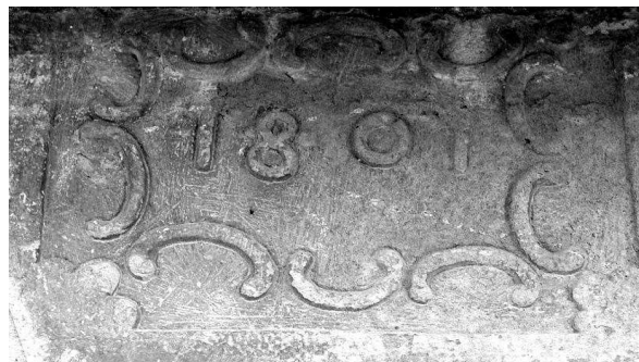
Llinda de la casa