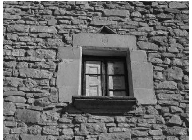
Finestra de la façana sud

de blat meitadenc, 17 de blat paumolós, 65 de blat segolós, 15 de mestall, i 8 quarteres de forment. Els preus de venda van ser respectivament, 36, 30, 36, 36, i 44 sous per quartera. En tots els casos el pagament es diferia fins el dia de la Mare de Déu d'Agost, després de la collita.