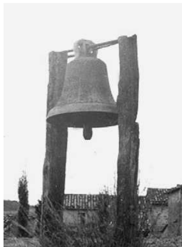
Campanar de l'església nova