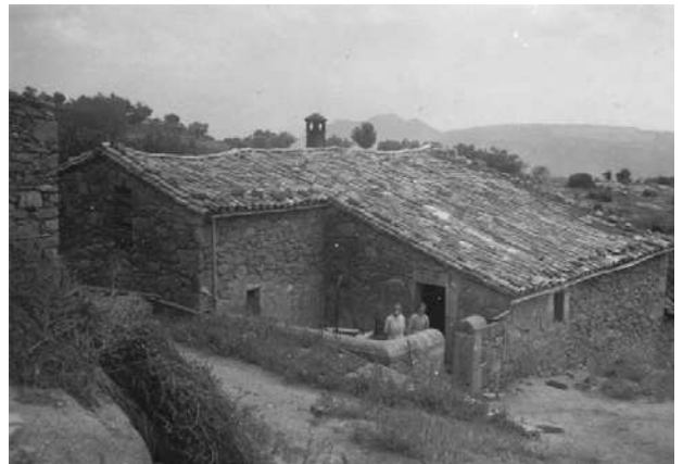
Vista des del cantó nord (c. 1938)