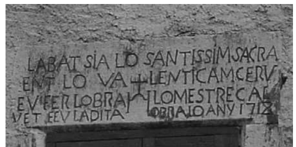
Inscripció sobre una finestra que dona a ponent