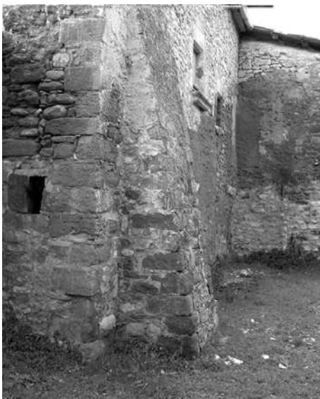
Contrafort a la façana nord de la casa