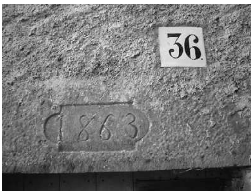
Porta del Porxo