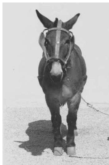
La darrera mula de l'Ernesto

cal Caietano, com la majoria dels pagesos del poble, es guanyaven la vida menant terres d'altri. Treballaven una vinya dita del mas Perera, d'unes 20 quarteres de superfície, de pertinències del mas Massana, un oliver d'unes 2 o 3 quarteres a les Costetes i un camp de 12 quarteres a la Plana, del mas Grauet, i un altre camp de 6 quarteres a la Creu, pertanyent a la Torre.