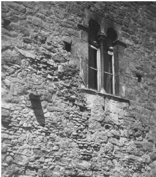
Finestral gòtic (1936)