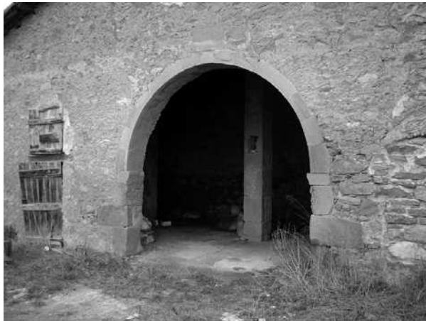
Cobert construït per Francesc Galí el 1790

de 1756 van signar una concòrdia. El Boixeda es va accontentar amb 115 lliures.