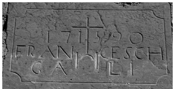
Llinda del cobert

El 1810 es van fer algunes obres de millora al cos principal de la casa de Boixeda. Hi ha la llinda d'una finestra que dona al nord que porta aquesta data. Aquell mateix any va casar a la Maria, segurament l'única filla que tenia. La va donar en matrimoni a l'hereu del mas Carner, una propietat que termeneja amb Boixeda, però que pertany a Sant Mateu. A més d'un generós dot de 500 lliures, dues calaixeres, una amb escambellet i l'altra convertible en escriptori, i un aixovar digne d'una princesa, el pare va donar a la filla i al gendre un tros de terra a l'extrem de la propietat, perquè hi poguessin construir un molí fariner. El tros no era gaire gran, tenia una amplada de 100 passes i anava de cingle a cingle, però era un punt estratègic per poder aprofitar les aigües abundoses que baixaven de la riera de Fontanet. L'agregat de cases conegut actualment amb el nom de Molí del Carner, té doncs l'origen en aquesta donació.