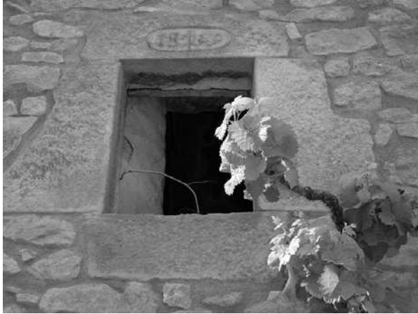
Edifici de la premsa

germà Ramon tenia més tirada a fer de pagès. El 1889 van comprar a l'amo de la Torre la terra que menaven a la Mallencosa, un olivar d'unes 13 quarteres. En van pagar més de 2.000 pessetes. Allà van edificar-hi una casa, però s'ignora qui pensava anar-hi a viure. L'any 1898 va morir el Francesc, sense haver tingut fills amb cap de les dues dones i, per disposició testamentària, el Ramon es va quedar amb tot.