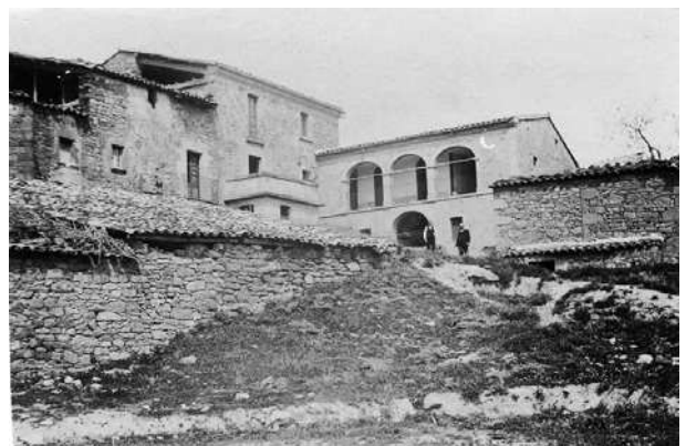
Grauet: vista de la façana sud