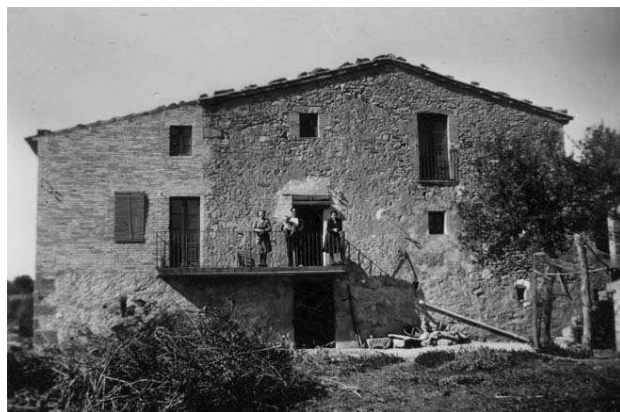
Cal Felip (1950)