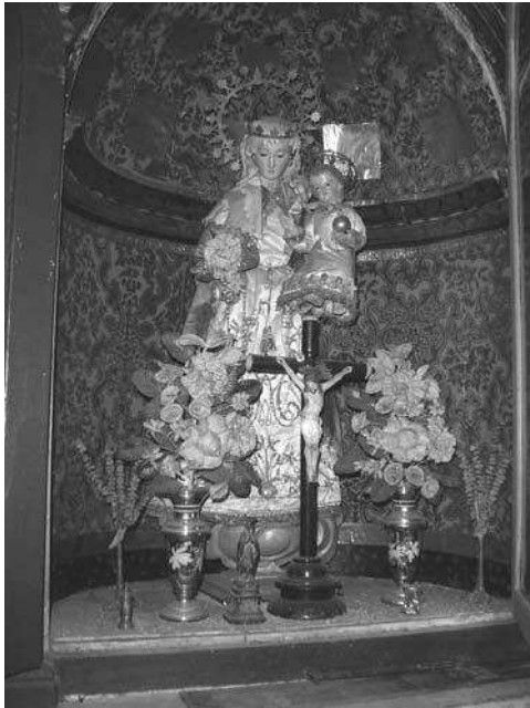
Mare de Déu que es troba en una fornícula a la sala