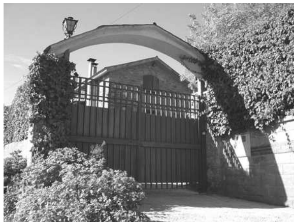
Entrada de Cal Xiscano