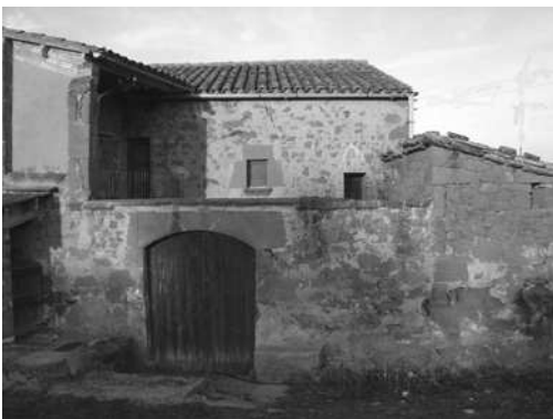
Portal de l'entrada