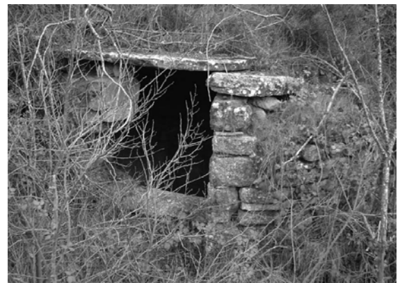
Pou dels horts de Cal Pere Negre