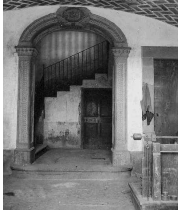
L'entrada del Mas Boixeda

bosc. Josep Galí va unir-se el 1847 amb Josefa Cortés Santmartí, de Callús. El dot va ser considerable, 1.000 lliures, en el qual hi havia incloses 250 lliures d'una pia causa fundada pel reverend Pau Corcó. Una pia causa era una mena d'assegurança per proveir de dot a les donzelles d'una família o un poble. L'aixovar de la Josefa era esplèndid. Dins de les dues calaixeres de noguer s'hi trobaven unes tovalles de 24 pams de llarg, 6 enagos, una cotilla de seda, 29 camises de bri i 7 de tela, 8 vestits molt bons, i molta més roba.