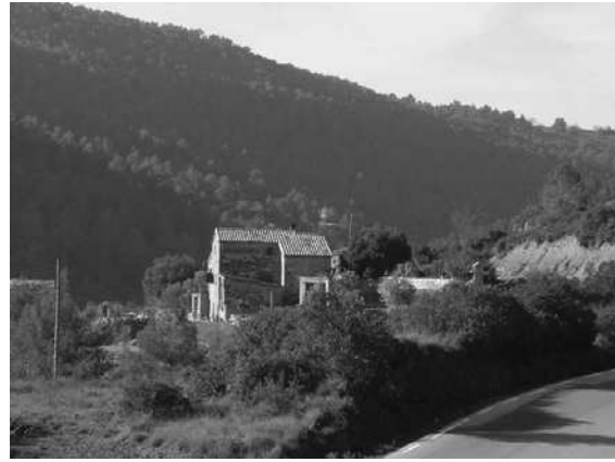
Cal Jaume Cases