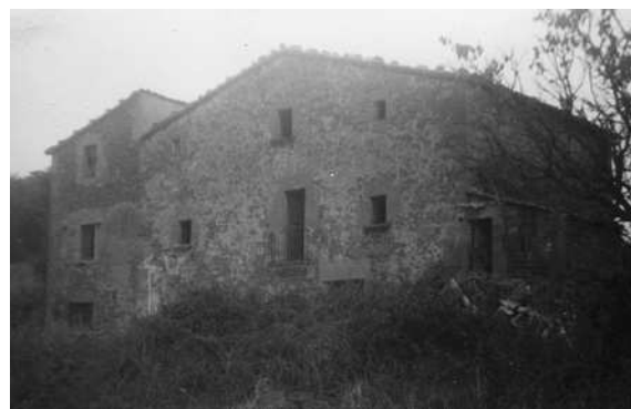
Cal Resi, 1975