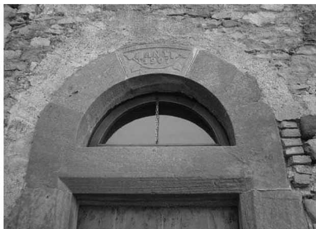
Portal de l'any 1907 del Mas Serra