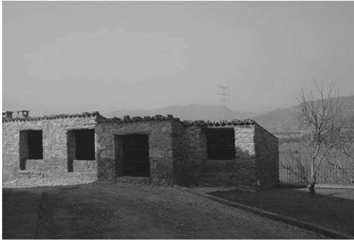
Tines del Mas Serra

Que direm de la Roseta quan a la primera nit li va veure la braqueta desatenta al seu marit: No m'haurieu enganyada si jo haguess cregut la gent ni tampoc m'haurieu vista a la casa del Junyent