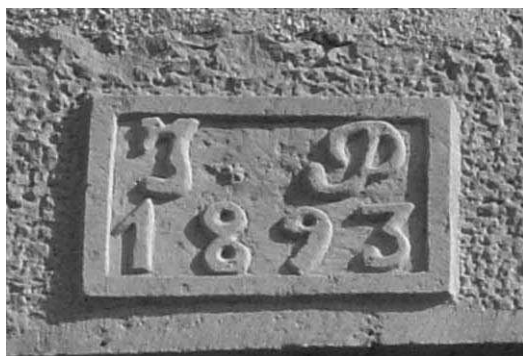
Llinda de Cal Piu

A més de pedra, també li va deixar triar 20 pals de pi per les bigues de la teulada. El preu de l'establiment va ser de 180 pessetes un tros i 800 l'altre. Com que el Puigdemívol no devia tenir calés, el Bastardes li va fer un préstec al moment de 870 pessetes sense interès, amb la condició que l'havia de tornar a finals de novembre del mateix any.